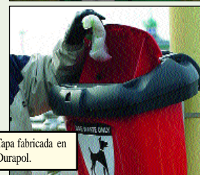
Tapa fabricada en Durapol.