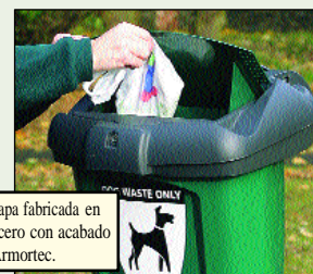
Tapa fabricada en acero con acabado Armortec.

Maximiza la resistencia a la intemperie, ofrece gran resistencia a golpes y no necesita mantenimiento de pintado.