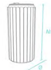
papelera con tapa