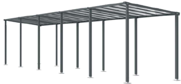
Ref. 529255 + 529256