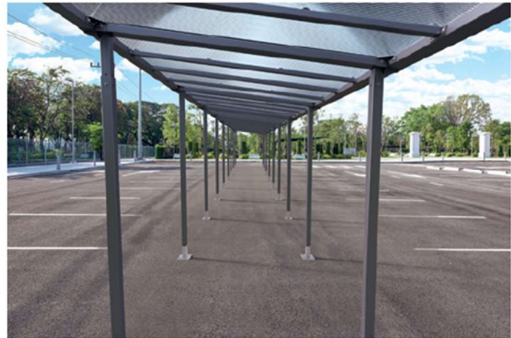
Ref. 529255 + 529256