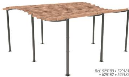
Ref. 529180 + 529181 + 529182 + 529183