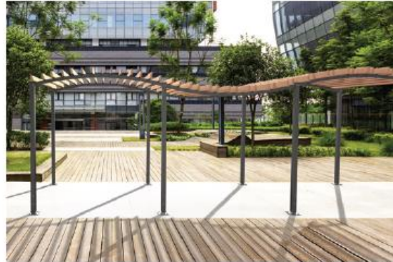
Ref. 529180 + 529181