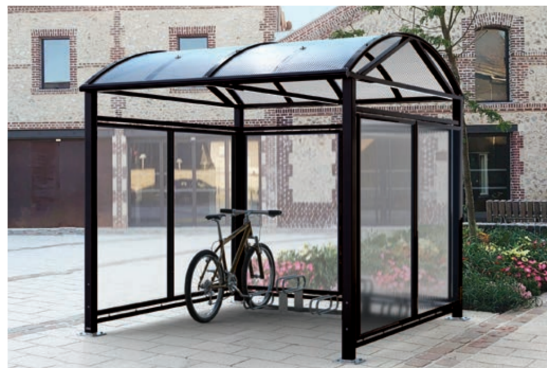
Ref. 529082 + 204719